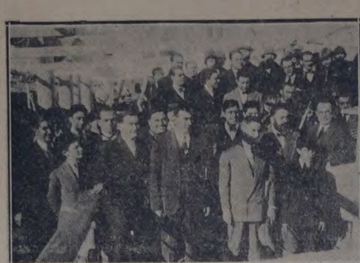
En el puerto, momentos antes de la salida de los delegados.